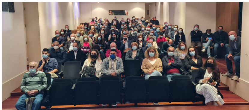
Plateia que assistiu à instalação dos novos órgãos autárquicos, onde também tomaram partido anterior elementos da Junta e Assembleia de Freguesia, bem como membros da listas do PSD e LIF, em sufrágio, a 26 de setembro último.

A cerimónia de tomada de posse dos novos órgãos autárquicos ficou marcada pela grande afluência de forjanenes, que assistiram à leitura do Compromisso de Honra de todos os eleitos, tendo as duas votações realizadas (vogais da junta e Assembleia) traduzido unanimidade (9 votos).