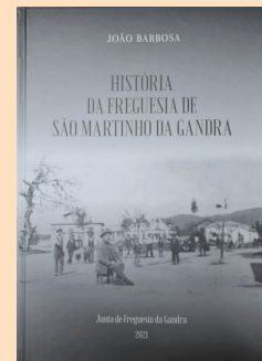
História da Freguesia de S. Martinho da Gandra, João Barbosa (326 pp); oferta através de Luis Coutinho

nas quais o meu Pai foi candidato, nunca em Forjães, um dos candidatos da lista vencida, repetiu a sua candidatura no ato eleitoral seguinte e saiu vencedor. Coube-me a mim quebrar esta lógica ao dar este passo, e fiz-lho, sem qualquer atrevimento de heroicidade, muito menos, contra alguém ou contra pessoas.