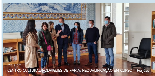
Mais em: CENTRO CULTURAL RODRIGUES DE FARIA: REQUALIFICAÇÃO EM CURSO - Forjães

A Junta de Freguesia de Forjães tem estado empenhada na dinamização do Centro Cultural Rodrigues de Faria, estando a acompanhar, de perto, as medidas previstas para a requalificação daquele espaço, em concreto a criação, no edifício, do “Centro Interpretativo do Junco” e, mais recentemente, a ansiada requalificação da Biblioteca “Sala Professora Irene Faria do Valle”, num investimento da Câmara Municipal de Esposende.