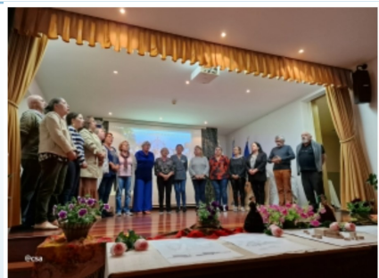
Grupo "As Cantadeiras do Vale do Neiva"