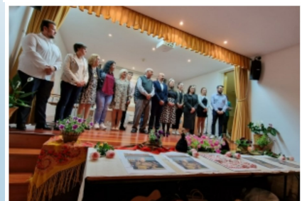
Direção do GADTF empossada a 05.05.2023