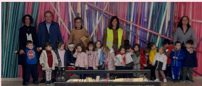
Foram dois os grupos de crianças do Jardim de Infância da Santa Casa da Misericórdia de Fão, que, em março, visitaram o Centro Interpretativo do Junco.