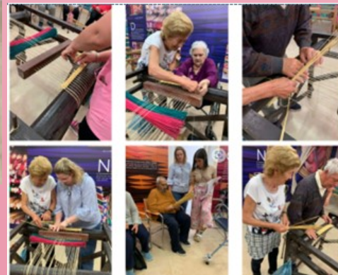
Utentes do Centro Social de Chafé, Viana do Castelo, visitaram, no dia 17 de maio, o Centro Interpretativo do Junco, que continua, assim, a ser motivo de interesse junto de instituições de outras localidades.