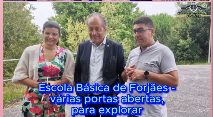
Escola Básica de Forjães - várias portas abertas, para explorar

Alguns dos registos que ilustram a visita da comitiva francesa, da Marie de Livry-Gargan, a Forjães, cujo registo pode ser acedido em Carta de Amizade Forjães Livry Gargan (youtube.com)