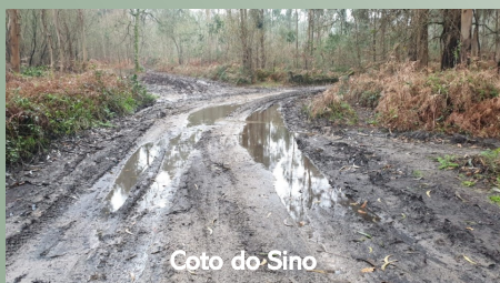
Coto do Sino

É intenção da Junta de Freguesia, conforme manifesto eleitoral de 2021, intervir neste arrumamento, em articulação com a beneficiação da Travessa da Av 30 de Junho e o reperfilamento da Av 30 de Junho, onde em breve será resolvida a questão da mina.