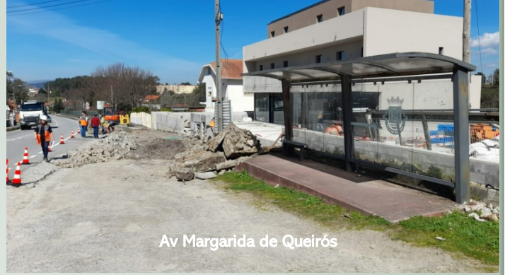
Av Margarida de Queirós