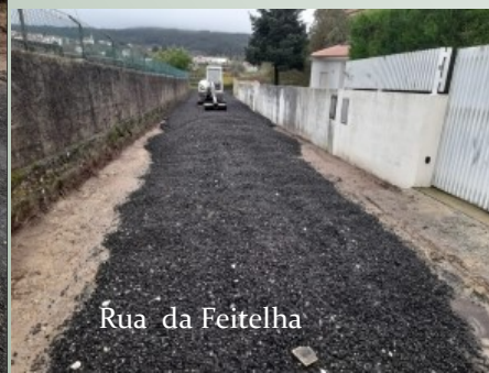
Rua da Feitelha

Prossegue a intervenção de valorização das vias de comunicação, desenvolvida pela Junta de Freguesia de Forjães, destacando-se, neste publicação, a intervenção feita na parte na parte poente da Rua de Linhares e Rua da Feitelha. Para além da limpeza da via e criação de penderes, nesta que é uma artéria com forte acumulação de águas pluviais, foi aplicado fresado de alcatrão, o que criou melhores condições de circulação, garantindo-se um acesso mais seguro a habitações e terrenos agrícolas e de mato, para além de ter sido melhorada a passagem para peões.