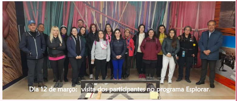
Dia 12 de março: visita dos participantes no programa Explorar.