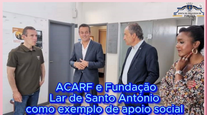
ACARF e Fundação Lar de Santo António como exemplo de apoio social