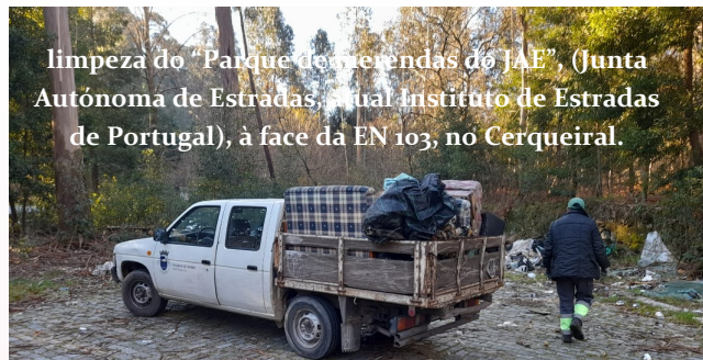
limpeza do “Parque das Ferreiras do JAE”, (Junta Autónoma de Estradas, atual Instituto de Estradas de Portugal), à face da EN 103, no Cerqueiral.

Não obstante, os colaboradores da Junta de Freguesia foram inextinguíveis nos seus esforços de limpeza dos arruamentos, tendo ainda um importante papel na recolha de verdes, tarefas que acaba por exigir muito tempo, dado o volume de verdes sinalizados ou colocados na via pública de forma abusiva. A afetação de recursos nesta tarefas deixa outras a descoberto, pelo que esta será uma das áreas a melhorar para 2024, até porque há responsabilidade dos jardineiros que têm a cargo a manutenção de alguns espaços verdes, ainda por cima quando a Junta de Freguesia disponibiliza um local para a sua colocação.