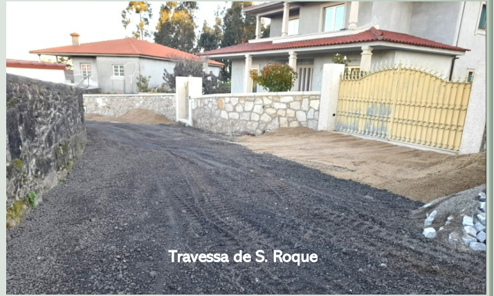
Travessa de S. Roque