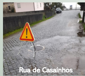
Rua de Casainhos

Junta de Freguesia realizou mais uma intervenção de resolução de problemas de águas pluviais, em concreto nos caminhos florestais na zona do Coto do Sino