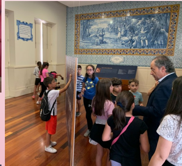
A 25 de maio foram os alunos do 4º ano do Centro Escolar de Forjães a visitar o Centro Cultural Escolas Rodrigues de Faria, incluindo-se uma visita guiada ao Centro Interpretativo do Junco.