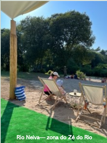
Rio Neiva— zona do Zé do Rio