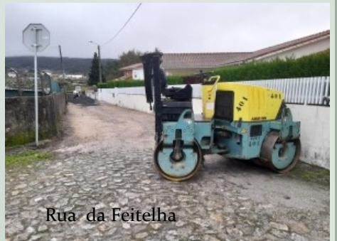
Rua da Feitelha