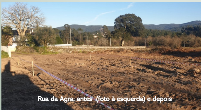
Rua da Agra: antes (foto à esquerda) e depois

A melhoria das condições climáticas, nos inícios de fevereiro, permitiu intervir numa das situações sinalizadas na Rua de Casainhos, tendo sido, através da Esposende Ambiente, reposto o pavimento abatido em redor da caixa de águas pluviais, próximo da ligação com a EN 103 (junto à casa do “Costinha”).