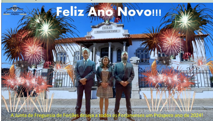
A Junta de Freguesia de Forjães deseja a todos os Forjanenses um Próspero ano de 2024!

Para todos os Forjanenses, presentes na sua terra ou ausentes noutras paragens, votos de um Próspero Ano Novo de 2024, repleto de realizações e sucessos, deixando também