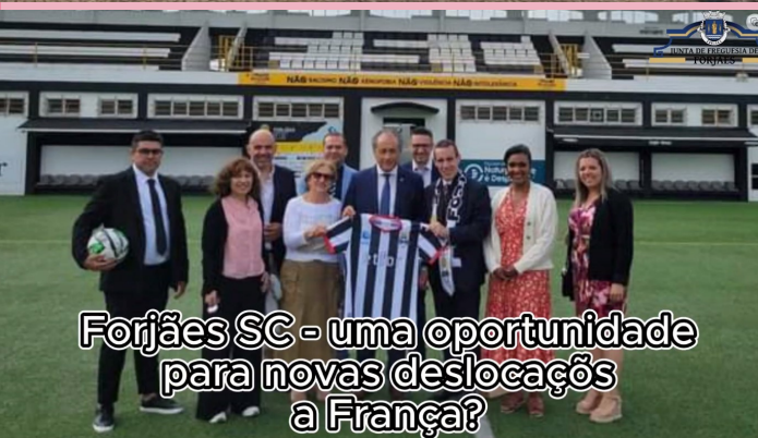
Forjães SC - uma oportunidade para novas deslocações a França?