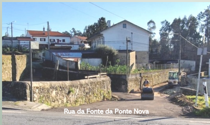
Rua da Fonte da Ponte Nova