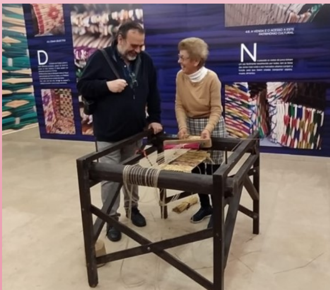
Centro Cultural Escolas Rodrigues de Faria, em Forjães, acolheu, em 11 de março, a visita de uma equipa de jornalistas da Telemino, canal de televisão da região de Ourense, Espanha.