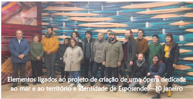
Elementos ligados ao projeto de criação de uma ópera dedicada ao mar e ao território e identidade de Esposende.—10 janeiro