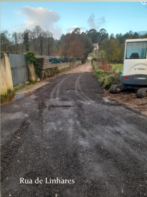
Rua de Linhares

Prossegue a intervenção de valorização das vias de comunicação, desenvolvida pela Junta de Freguesia de Forjães, destacando-se, neste publicação, a intervenção feita na parte na parte poente da Rua de Linhares e Rua da Feitelha. Para além da limpeza da via e criação de penderes, nesta que é uma artéria com forte acumulação de águas pluviais, foi aplicado fresado de alcatrão, o que criou melhores condições de circulação, garantindo-se um acesso mais seguro a habitações e terrenos agrícolas e de mato, para além de ter sido melhorada a passagem para peões.