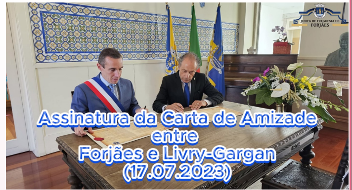
Assinatura da Carta de Amizade entre Forjães e Livry-Gargan (17.07.2023)