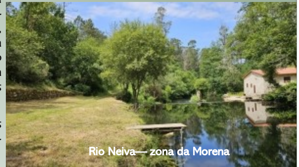
Rio Neiva— zona da Morena

Este é um gesto que merece ser reconhecido e enaltecido por todos os forjanenses, e que serve de exemplo de para toda a comunidade, demonstrando que todos podemos cuidar do bem comum. .