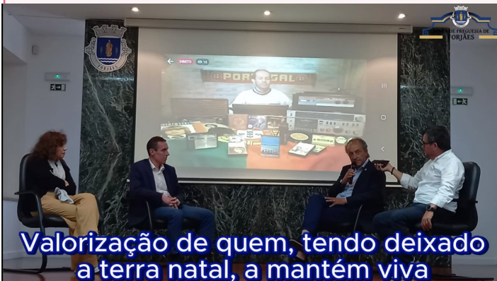
Valorização de quem, tendo deixado a terra natal, a mantém viva