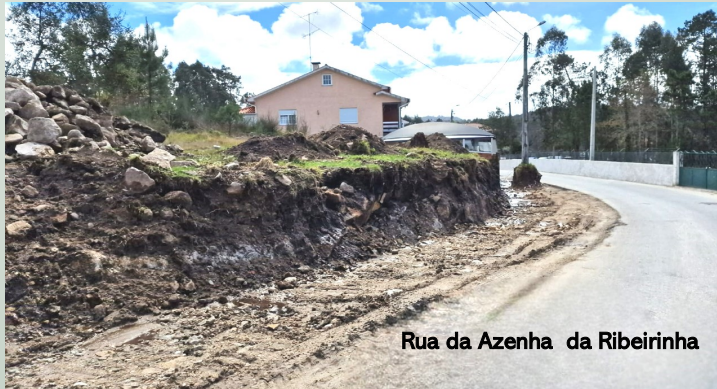
Rua da Azenha da Ribeirinha

Nesta intervenção foi efetuado o alargamento da rua, entre a zona poente e a zona nascente, pelo que foi necessário articular esta pretensão com os diversos proprietários que confrontam com a mesma rua. Enaltecemos, neste capítulo, a colaboração demonstrada por todos os intervenientes, sem a qual não seria possível uma resolução tão imediata desta intenção. Todos compreenderam a importância deste melhoramento e cederam, gratuitamente, as áreas necessárias para o efeito. Muito obrigado a todos, na certeza de que estas posturas são de enaltecer.