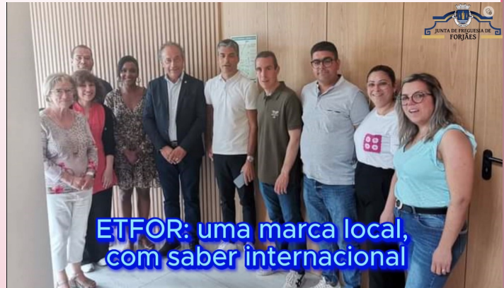
ETFOR: uma marca local, com saber internacional